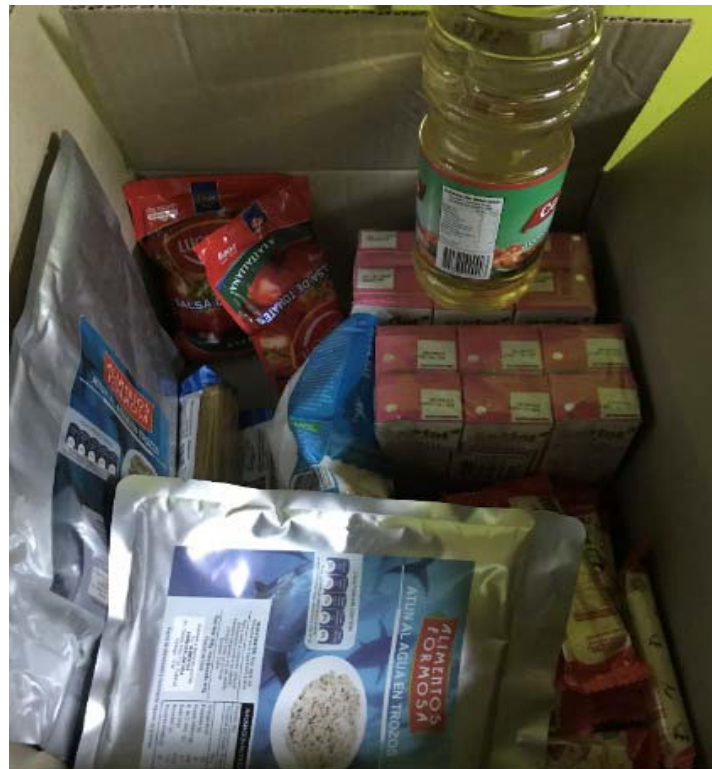
Imagen 9: 1 Canastas sin 3 leches de 200 cc..