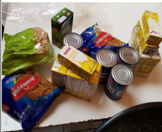
Imagen 7: 1 Canastas con 4 tarros de jurel.