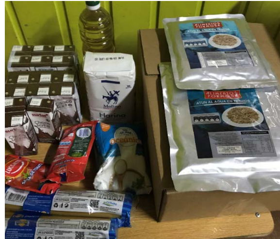
Imagen 11: 2° Canasta.