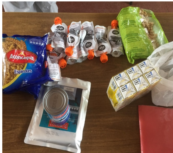
Imagen 5: 2 Canastas sin 9 leches cada una.