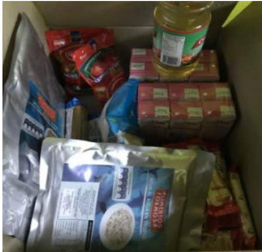
Imagen 10: 1° Canasta.