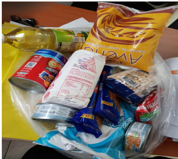
Imagen 2: 1 Canastas pertenecientes a la 2° entrega.