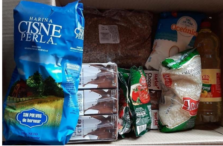
Imagen 8: 1 Canastas sin 1 tarro de jurel.