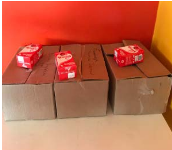
Imagen 1: 3 Canastas pertenecientes a la 2° entrega, 1 con la zanahoria en mal estado.