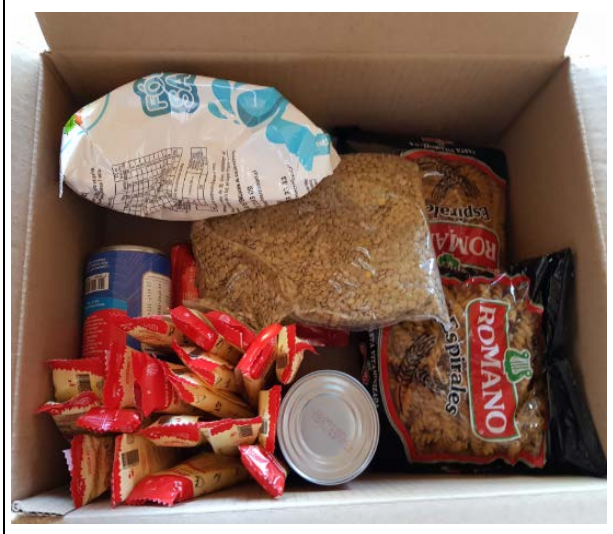
Imagen 6: 1 Canastas con 19 barras de cereal.